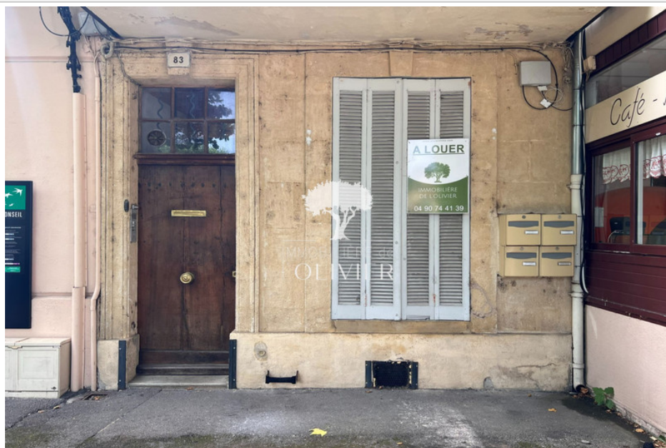
Bureau 202421 Apt