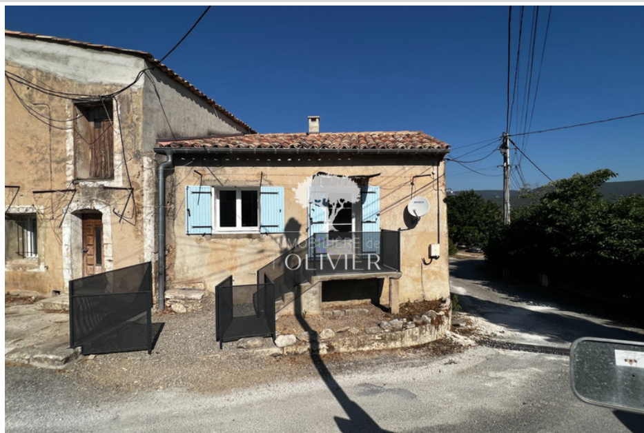
Maison de village / ville 2319 Saint-Saturnin-lès-Apt

luberon, t2 small house in hamlet comprising a living room with kitchen, a bathroom with toilet and bedroom. location for green space vehicle available. Heating electric, empty rental period 36 (months) ecd class: f