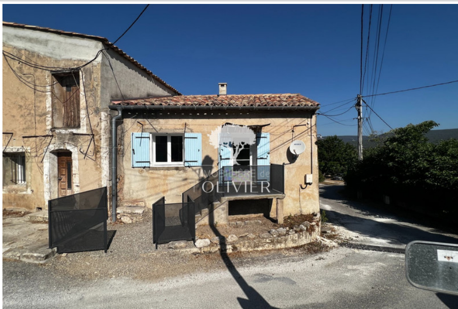
Maison de village / ville 2319 Saint-Saturnin-lès-Apt

Emission de gaz à effet de serre (ges) : C